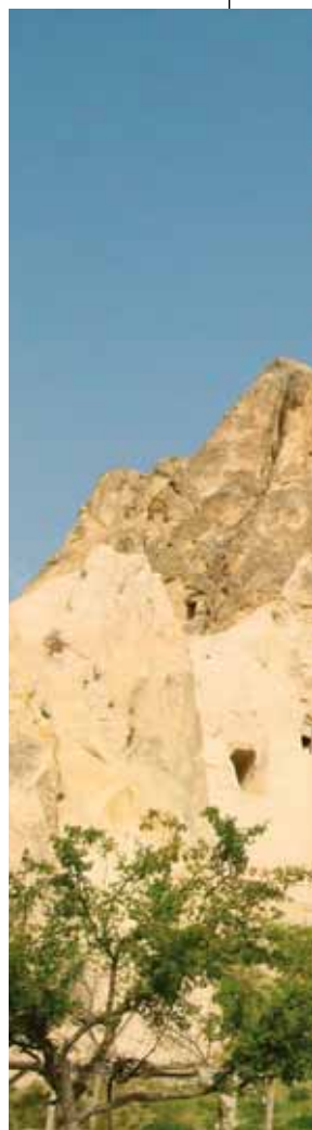
▲ Open Air Museum

Po ponad dwugodzinnym marszu opuszczamy dolinę i udajemy się w kierunku widocznego z oddali zamku w Uchisar. Podejście na wzgórze, na którym stoi, w samo południe to istna mordęga. Idziemy po brukowanej drodze,