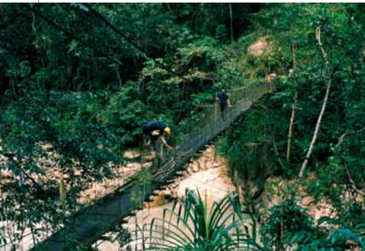
▲ Jeden z „nowocześniejszych” mostów w dolinie rzeki Arun. Wschodni Nepal, 1998.