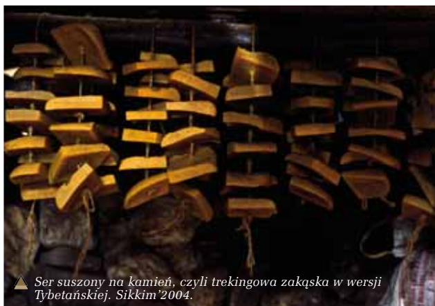
▲ Ser suszony na kamień, czyli trekkingowa zakąska w wersji Tybetańskiej. Sikkim'2004.

wydłużyć odcinki, zwiększyć problem wysokości czy zapaść się na takie od-ludzia, że cały prowiant na kilka tygodni będziemy musieli zabrać na plecy. Można też wybrać się na luksusową wycieczkę pieszą np. w Himalajach – gdzie w cenie są tragarze, więc niesiemy tylko miniplecaczek, tzw. daypack, noclegi są w lokalnych schroniskach górskich – pyszne, gotowe żarcie i codziennie ciepły prysznic. Decyzja należy do każdego z osobna i każdy znajdzie coś dla siebie. Bardzo lubię trekking przed wspinaczką. Sądzę, że jest to świetny sposób na zła-