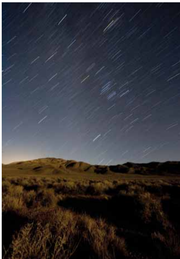
▼ Ruchy gwiazd nad najgłębszą depresją na Półkuli Północnej - 86 m p.p.m. Death Valley, California, USA, 2007.