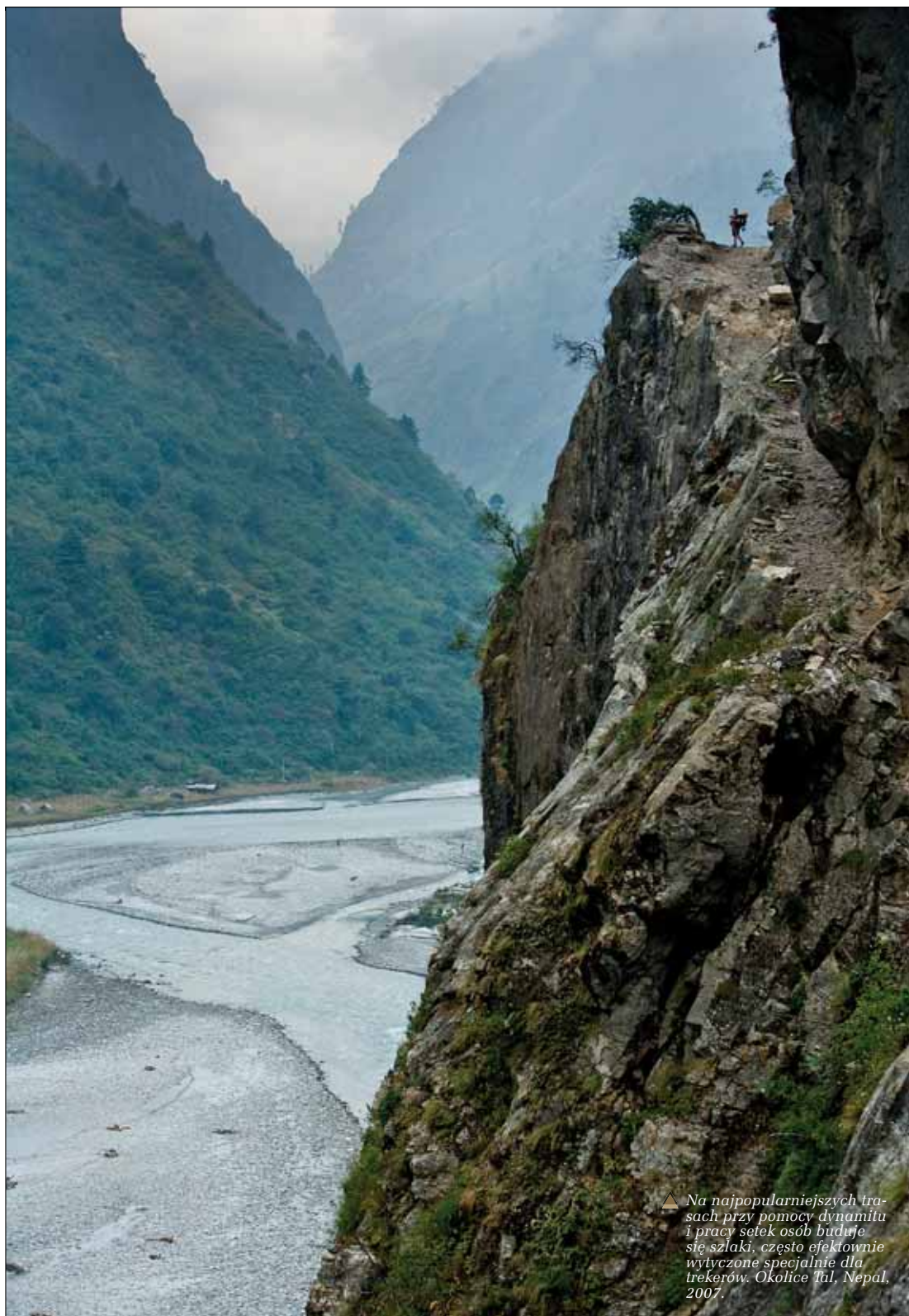
▲ Na najpopularniejszych trasach przy pomocy dynamitu i pracy setek osób buduje się szlaki, często efektywnie wytyczone specjalnie dla trekerów. Okolice Tul, Nepal, 2007.