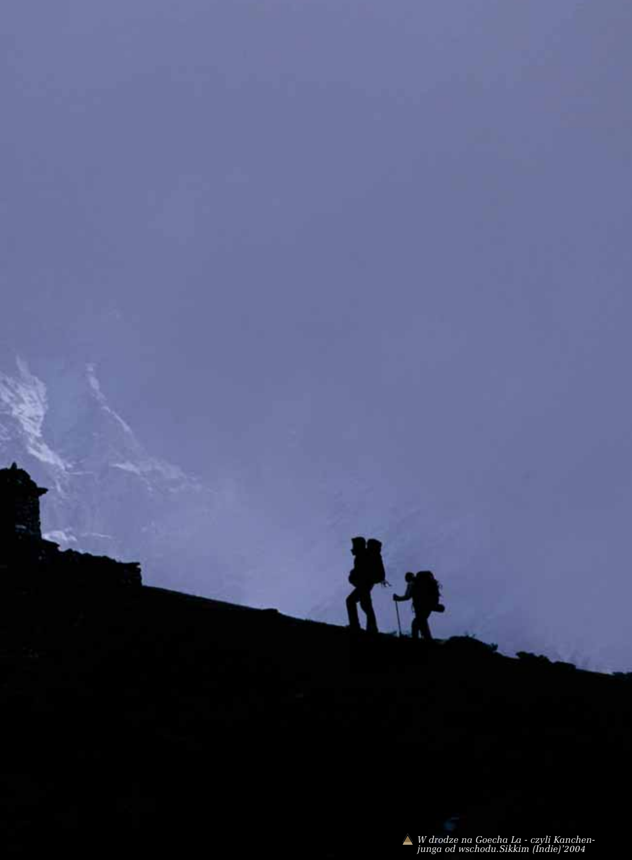
▲ W drodze na Gocha La - czyli Kanchenjunga od wschodu. Sikkim (Indie) 2004