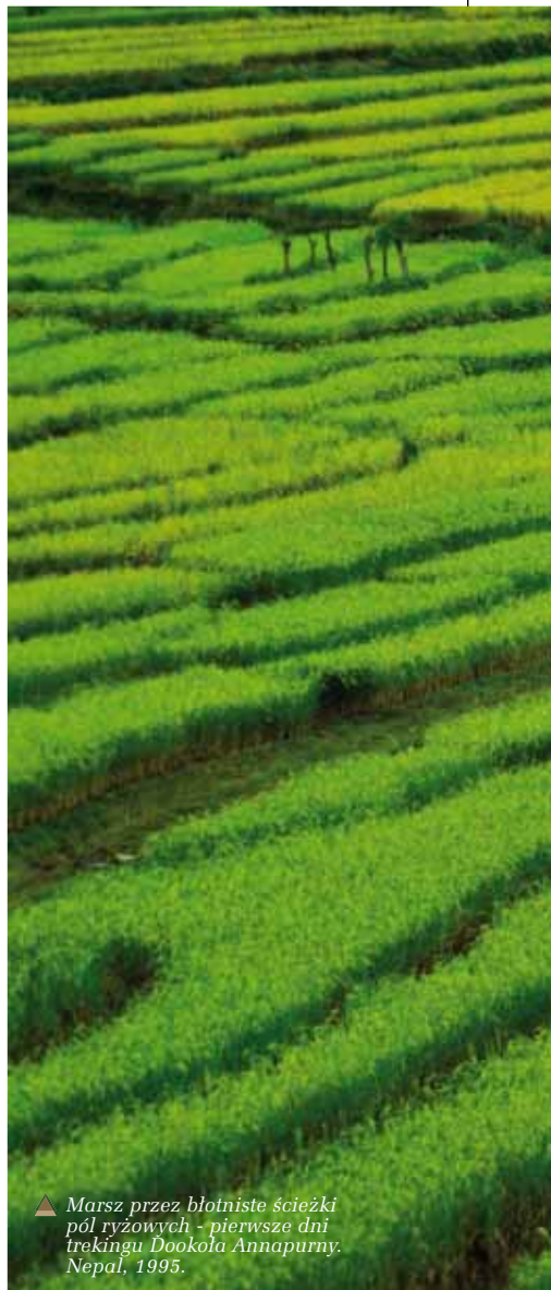
▲ Marsz przez błotniste ścieżki pól ryżowych - pierwsze dni trekkingu Dookoła Annapurny. Nepal, 1995.

zrobiłaby się megaafiera w ONZ i paru innych miejscach. W takich Indiach wstęp do parku narodowego potrafi być prawie darmowy dla Hindusa, Nepalczyka, Pakistańczyka (kraje te są wciąż w stanie wojny) czy obywatela Sri Lanki i kosztować np. 1 czy 2 dolary i to np. na tydzień, a dla nas, wszystkich pozostałych może kosztować 80 albo 170 USD. W Nepalu np. bilet wstępu jest niezbędny, żeby wejść na Durbar Square – czyli lokalne formy rynku/starówki. Jakoś nie mogę sobie wyobrazić kolesia, który wylapuje kolorowych