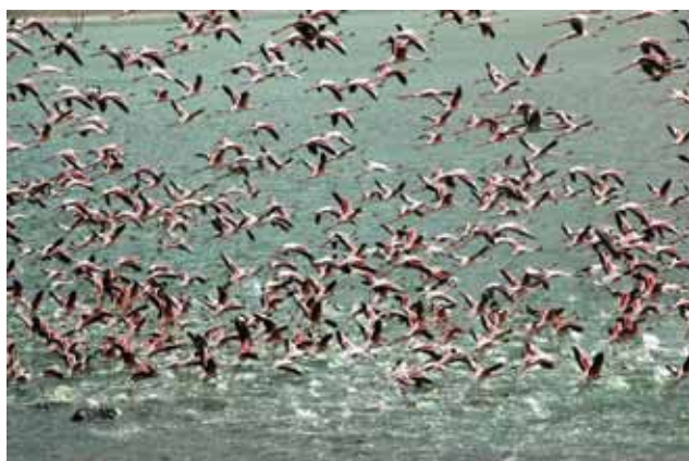
▲ Flamingi nad jeziorem alkalicznym w kraterze Empakaj