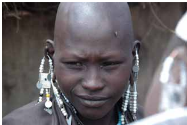
▲ Urodziwa Masajka z okolic Nairobi