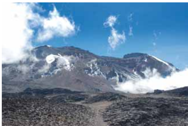
▲ Gdzieś między drugim a trzecim obozem na drodze Machame