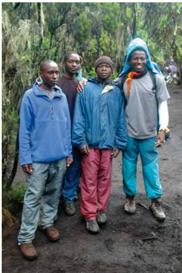
▲ Autochtońska część naszej ekipy

szym posiłkiem był kurczak z frytkami oraz coca-cola. Następnego dnia wychodziliśmy już w górę, więc wieczór minął na pakowaniu całego potrzebnego nam ekwipunku.