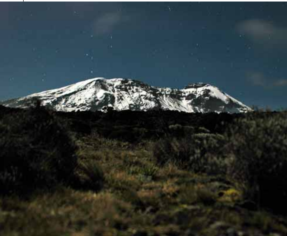
▲ Masyw Kilimanjaro w świetle księżycy z New Shira Camp.

nym przebywaniu na szczycie rozpoczęliśmy zejście. Bezchmurne niebo towarzyszyło nam do Stella Point, gdzie weszliśmy w chmury. Teraz czekał nas nieprzyjemny fragment drogi, prowadzący ogromnym usypiskiem z kamieni, pokrytym grubą warstwą topniejącego i mokrego śniegu. Na wysokości 5000 m n.p.m. padający śnieg zamienił się w deszcz. Po dotarciu do naszej bazy (Barafu Hut) zrobiliśmy godzinny odpoczynek, przeznaczony na posiłek i pakowanie całego sprzętu, po czym ruszyliśmy w dół, drogą zwaną Mweka . Zejście prowadziło przez „księżycowy” krajobraz, olbrzymimi polami pełnymi wulkanicznych form. Po ok. 4 godzinach doszliśmy do miejsca noclegu, położonego już w strefie lasu tropikalnego na wysokości 2900 m n.p.m. Kolejny dzień to dalszy ciąg zejścia do bramy parku, którą osiągnęliśmy ok. południa. Po załatwieniu wszystkich formalności i odebraniu pamiątkowych dyplomów, wsiedliśmy do samochodu, który zawiózł nas do naszego hotelu w Moshi.