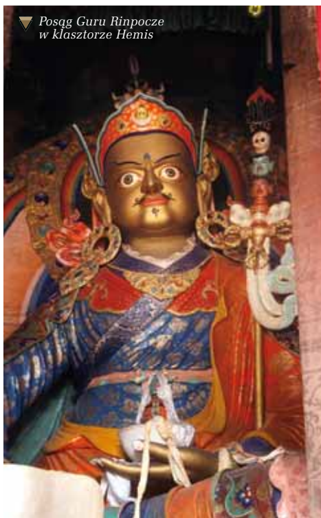
▼ Posąg Guru Rinpoche w klasztorze Hemis