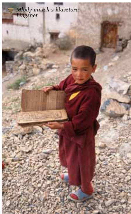
Młody mnich z klasztoru Lingshet