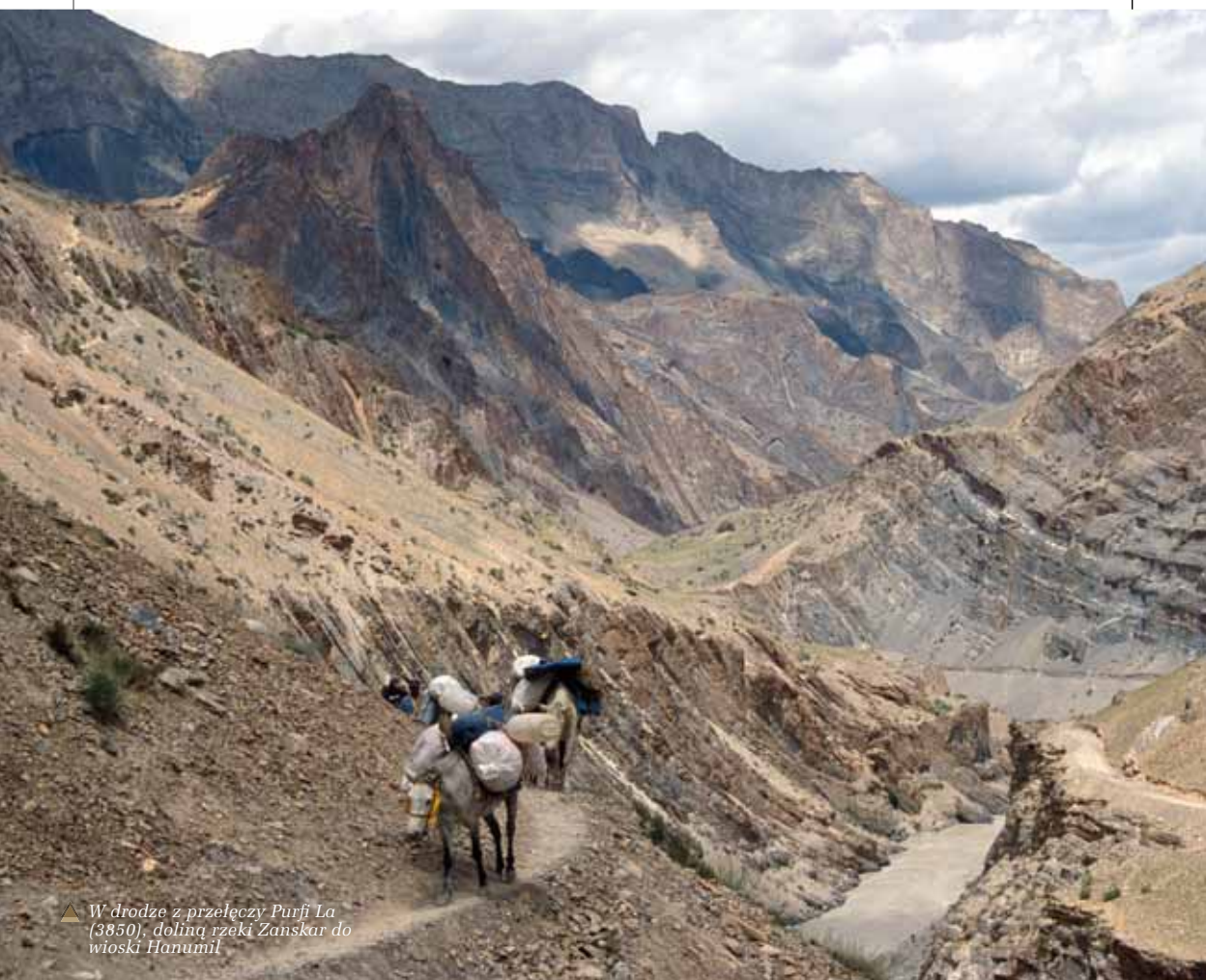
▲ W drodze z przełęczy Purfi La (3850), doliną rzeki Zaskar do wioski Hanumit

W czasie mojego pobytu w 1994 r. miał miejsce okres rekordowych upałów i doświadczając w lipcu 50°C w stolicy przy monsunowej wilgotności i opadach, obiecałem sobie, że zawsze będę wyjeżdżał do Indii w okresie pozamonsunowym z wyjątkiem podróży do Ladaku i Kaszmiru. Tym razem początek sierpnia w Delhi był dla nas łaskawy ze swoimi 40° ciepła, a jednodniowy odpoczynek w klimatach „backpackersowskiej” dzielnicy Pahargandź w rejonie dworca kolejowego New Delhi, pozwolił przypomnieć klimaty Delhi z poprzednich pobytów: przesiadanie w położonych na dachach hoteli knajpkach, popijanie lassi – zimnego rodzaju jogurtu, kosztowanie kolejnych serowych potraw w kilkunastu różnych sosach i rozmowy do 2 w nocy ze zbieraniną ludzi z całego świata.