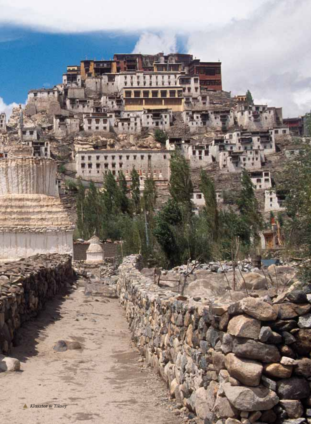
▲ Klasztor w Tiksey