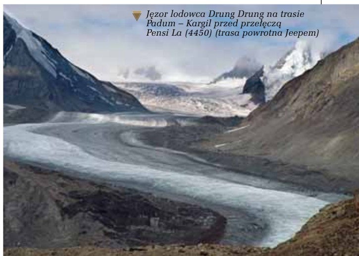
▼ Jezor lodowca Drung Drung na trasie Padum – Kargil przed przełęczą Pensi La (4450) (trasa powrotna Jeepeem)

W czasie mojego pobytu w 1994 r. miał miejsce okres rekordowych upałów i doświadczając w lipcu 50°C w stolicy przy monsunowej wilgotności i opadach, obiecałem sobie, że zawsze będę wyjeżdżał do Indii w okresie pozamonsunowym z wyjątkiem podróży do Ladaku i Kaszmiru. Tym razem początek sierpnia w Delhi był dla nas łaskawy ze swoimi 40° ciepła, a jednodniowy odpoczynek w klimatach „backpackersowskiej” dzielnicy Pahargandź w rejonie dworca kolejowego New Delhi, pozwolił przypomnieć klimaty Delhi z poprzednich pobytów: przesiadanie w położonych na dachach hoteli knajpkach, popijanie lassi – zimnego rodzaju jogurtu, kosztowanie kolejnych serowych potraw w kilkunastu różnych sosach i rozmowy do 2 w nocy ze zbieraniną ludzi z całego świata.